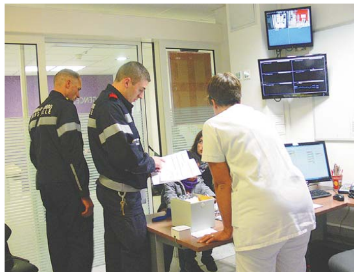
Les Pompiers de Marseille viennent de conduire un enfant aux Urgences