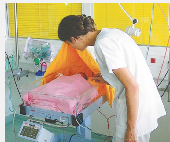
Surveillance et attention pour un enfant prématuré