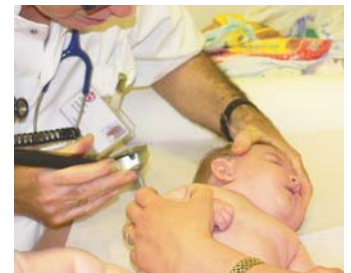
L'enfant est systématiquement ausculté

Les travaux de 2017 permettront de progresser encore dans la prise en charge de chaque enfant, dans des locaux plus accueillants et fonctionnels.