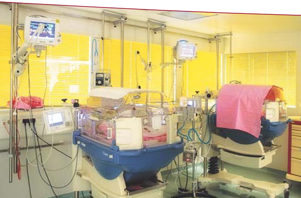
A chaque étape de prématurité une couveuse particulière