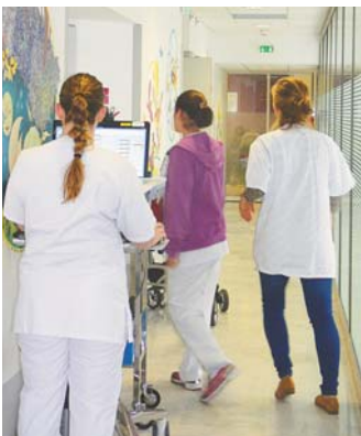
L'équipe médicale se rend auprès d'un enfant