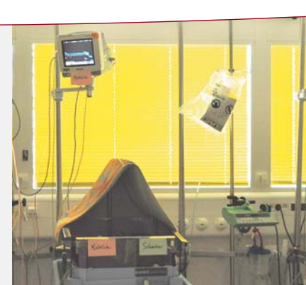
Calme et lumière maîtrisée en néonatalogie