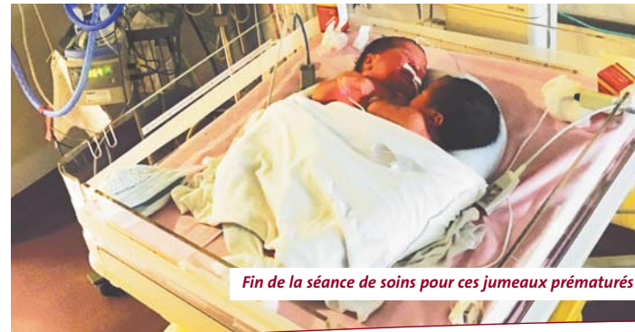
Fin de la séance de soins pour ces jumeaux prématurés