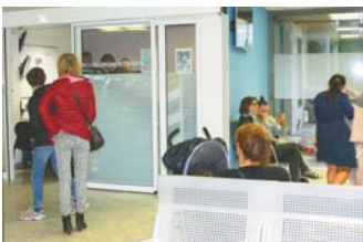
La Salle d'attente des Urgences enfants