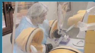
Préparation d'un traitement de chimiothérapie

A l'Hôpital Saint Joseph, une intervention chirurgicale sur cinq concerne le cancer et plusieurs milliers de personnes sont soignées chaque année par la médecine et par chimiothérapie. Les équipes médicales et chirurgicales sont totalement engagées dans ce combat contre la maladie qui nécessite à la fois des investissements importants et une innovation permanente. Ces équipes médicales participent à la Recherche Médicale pour préparer les médicaments, les traitements et les dispositifs médicaux de demain.