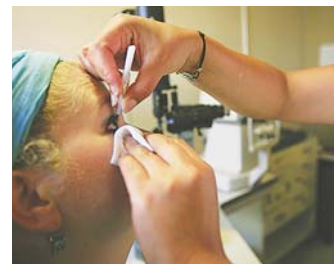
Collyre préparatoire à un examen

Le service de consultations du service d'ophtalmologie reçoit 120 personnes par jour, plus de 25 000 par an.