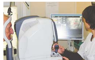
L'importance des nouveaux matériels pour un meilleur diagnostic