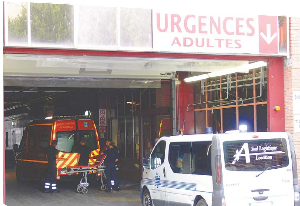
Pompiers et ambulanciers conduisent les patients aux Urgences de l'Hôpital Saint Joseph.