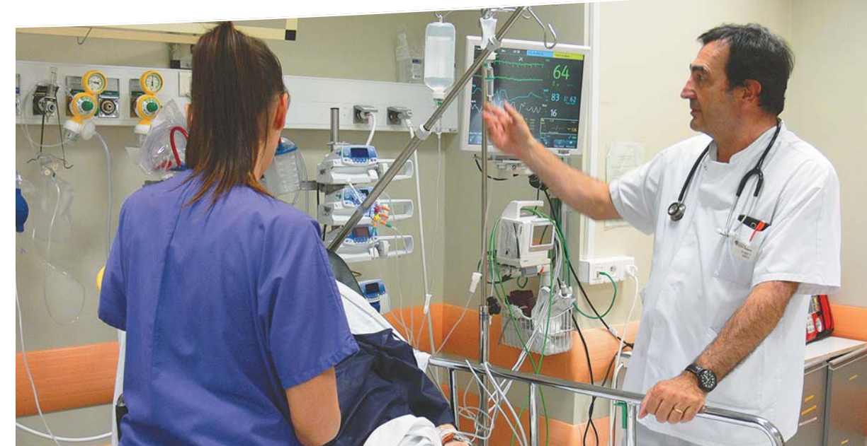
Le service a besoin d'une seconde place de déchocage, lieu qui ressemble à une chambre de réanimation, réservé aux malades en situation d'urgence majeure.