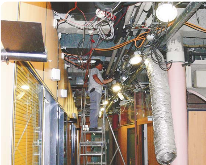
Sur le chantier du Service des Urgences.