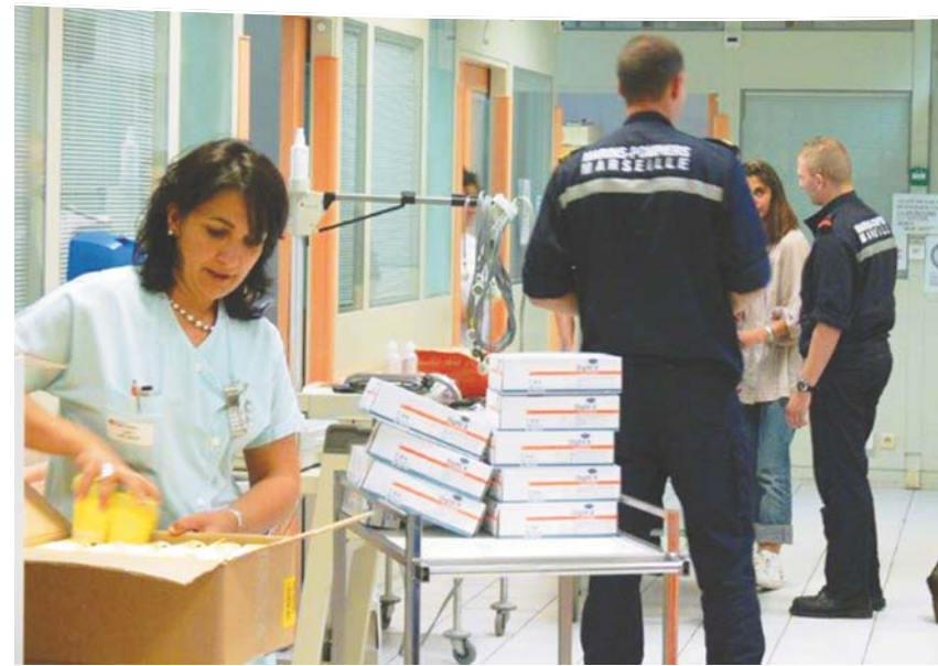
Jour et nuit les patients sont pris en charge aux Urgences.