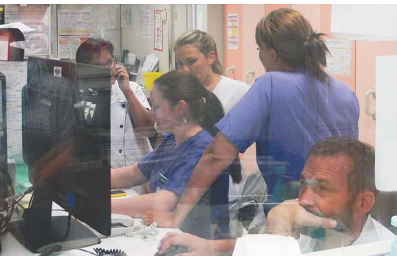
Le personnel a été renforcé dès 2011.