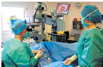
Chirurgie ophtalmologique enfant, sous microscope opératoire

Les équipes ont besoin d'un équipement complet portable installé sur chariot , pour agir au plus près de l'enfant malade.